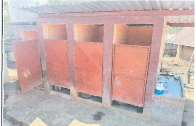
Foto 4: MEJORAMIENTO DE MODULO DE SANITARIOS POR DETERIORO DE LOS MISMOS.

Observación: Si es necesario se pueden agregar hojas adicionales y actualizar el número de hojas.