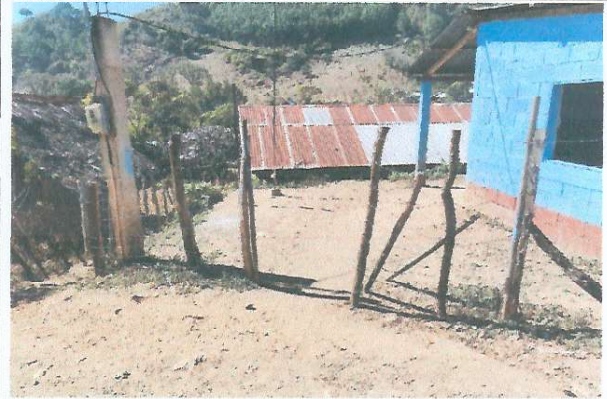
Foto 2: ÁREA DONDE SE DESEA MEJORAR EL PORTÓN DE INGRESO AL ESTABLECIMIENTO.