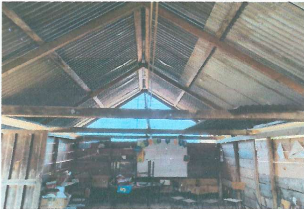
Foto 3: ÁREA DONDE SE REALIZARÁ EL MEJORAMIENTO DE SISTEMA ELÉCTRICO